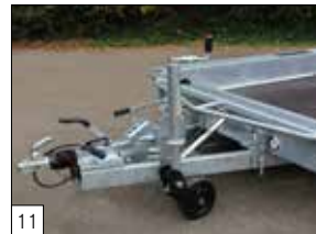
Standaard: een versterkt opklapbaar steunwiel en de voorzijde is versterkt.