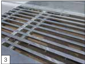
Standaard: versterkt chassis.