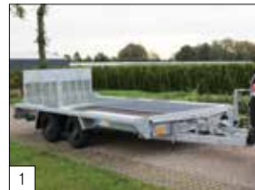
Standaard: bruto laadvermogen van 3500 kg.