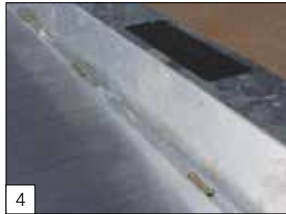
Standaard: bindbeugels TÜV gekeurd en Safety Steps op de zijkanten.