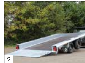
Standaard: Indigo LT als kantelbare tandemmasser leverbaar in 410 x 184 cm.