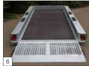
Standaard: een spits toelopende oprijklep bestaande uit een stalen, antislip looprooster-profiel. De klep is volbad gegalvaniseerd en voorzien van een veer.