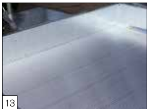
Optie: aluminium profiel-vloer gemonteerd i.p.v. multiplex.