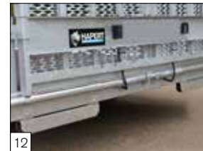
Standaard: afsteuning laadvloer indien gekanteld.