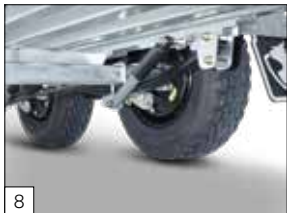
Standaard: paraboolvering incl. schokbrekers gemonteerd.