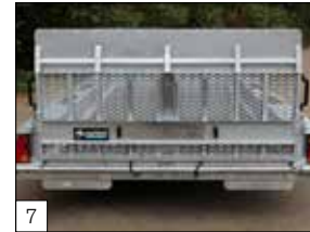
Standaard: oprijklep ca. 120 cm lang scharnierend aan de achterzijde met 2 uitneembare hoekkronen en instelbare sluitingen.