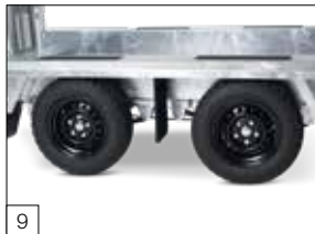
Standaard: banden 195/50 R13 C met zwarte velg.