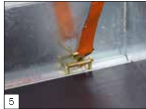
Standaard: bindbeugels geïntegreerd in de vloer: 1000 daN per stuk.