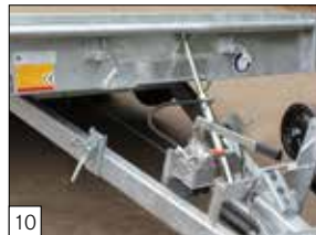
Standaard: hydraulisch kantelbaar, dubbelwerkend systeem incl. smoorventiel.